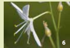
Ästige Graslinie Die seltene Blume blüht hier noch in größeren Beständen.

Die mageren Böden und die Beweidung verhinderten die Entwicklung dichtwüchsiger Wälder. Stattdessen entstanden lichtdurchflutete, offene Kiefernwälder. Hier kommen sowohl typische Pflanzen und Tiere der Wälder vor, als auch Arten, die üblicherweise im Offenland leben. Hinzu kommen spezielle „Saumarten“, die vor allem Waldränder besiedeln.