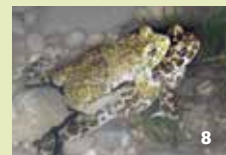
Wechselkröte Die Fröttmaninger Heide beherbergt die bedeutendste Population in Bayern.