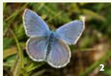
Idas-Bläuling Der stark bedrohte Falter hat in München seinen Verbreitungsschwerpunkt in Bayern.

Die Fröttmaninger Heide ist die größte noch erhaltene Fluss-Schotterheide Süddeutschlands. Sie entstand vor etwa 10.000 Jahren durch das Gesteinsgeschiebe der Gletscher und deren Schmelzwasser. Dieser Lebensraum ist durch Trockenheit und Nährstoffarmut gekennzeichnet. Der Kiesboden wird dennoch – oder gerade deshalb – von zahlreichen seltenen Pflanzen und Tieren besiedelt, die sich perfekt an die Wasser- und Nährstoffknappheit angepasst haben. Die Fröttmaninger Heide wird durch die Autobahn A99 in zwei Teilbereiche getrennt. Der nördliche Teil wird noch als Standortübungsplatz der Bundeswehr genutzt, südlich der Autobahn ist das Gebiet seit 2016 auf 347 Hektar als Naturschutzgebiet „Südliche Fröttmaninger Heide“ ausgewiesen. Zudem ist die Fröttmaninger Heide (Nord und Süd) eine Teilfläche des europäischen Natura 2000-Schutzgebiets „Heideflächen und Lohwälder nördlich von München“.