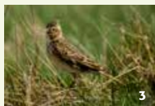
Feldlerche Der Bodenbrüter baut sein Nest in den großen Heidewiesen.