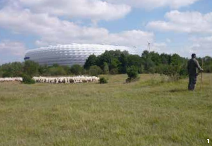
Beweidung durch Schafe hält die wertvollen Heideflächen von Verbuschung frei.