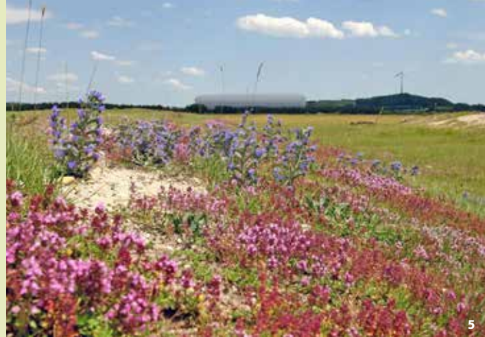
Magerrasen in der Fröttmaninger Heide