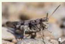
Blaufügelige Ödlandschrecke Trotz ihrer guten Tarnung kann man sie im Sommer häufig auf den Wegen und offenen Kiesflächen der Heide beobachten.